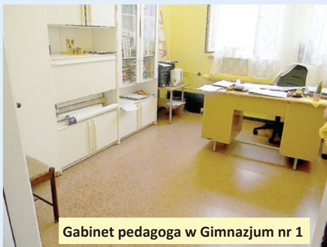
Gabinet pedagoga w Gimnazjum nr 1