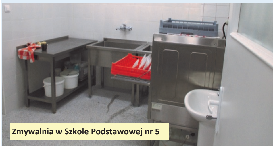
Zmywalnia w Szkole Podstawowej nr 5