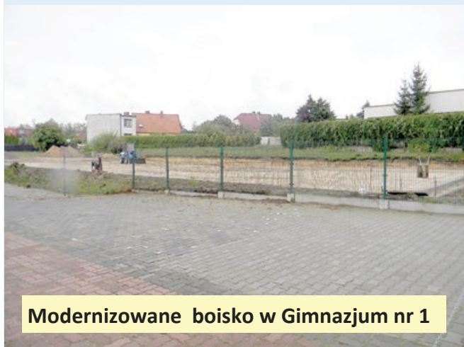
Modernizowane boisko w Gimnazjum nr 1

Myszę, że robimy bardzo dużo, aby podnieść standard nauki w naszych placówkach. Wyremontowano już większość dachów, zostały do wymiany nieliczne okna. W każdej szkole mamy nowoczesne kotłownie, przy większości szkół boiska wielofunkcyjne, sporo sal gimnastycznych. Te szkoły, które dotychczas miały nie najlepsze pracownie komputerowe, teraz mają się czym pochwalić. Chciałem jeszcze zauważyć, że większość prac bieżących wykonywana jest oszczędnościowo „własnymi siłami”. Dzisiaj faktycznie etat woźnego zmienił swoją formę, to już konserwatorzy, tak zwane "złote rączki", wiele rzeczy robią sami. Na tym oszczędzamy, bo wtedy środki przeznaczone są tylko na materiały. Uważam, że nie mamy się czego wstydić, jeżeli chodzi o stan techniczny naszych placówek.