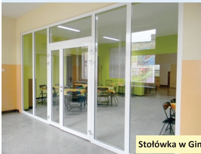
Stołówka w Gimnazjum nr 1

Ilość zadań, którymi zajmujemy się w zakresie funkcjonowania oświaty, jest naprawdę ogromna. To nie tylko największa część naszych corocznych wydatków budżetowych, ale i ogromny zakres obowiązków. Przypomnę, że w obecnym stanie prawnym na naszym terenie funkcjonuje 17 placówek, to znaczy trzy gimnazja, jeden zespół szkolno-gimnazjalny, dwa zespoły szkolno-przedszkolne, szkoły podstawowe, w tym dwie o statusie klas 1-3, czyli Szkoła w Karpicku i Szkoła nr 5 w Wolsztynie, a pozostałe szkoły o statusie 1-3 są to szkoły filialne zgodnie z przyjętymi przez Radę uchwałami.