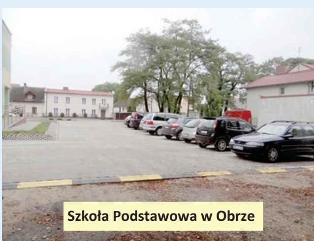
Szkoła Podstawowa w Obrze