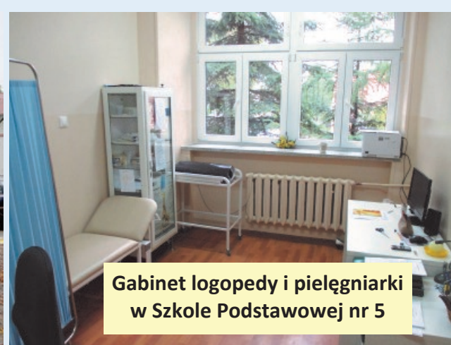
Gabinet logopedy i pielęgniarki w Szkole Podstawowej nr 5